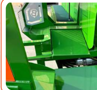
↓ MENSOLA BASCULANTE DI SELEZIONE CEPPO PICCOLO