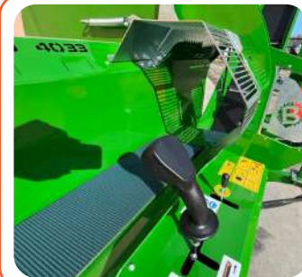
PRATICA CONSOLLE DI LAVORO PER AVANZAMENTO E TAGLIO CON JOYSTICK