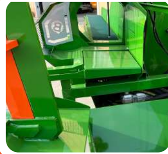
↑ MENSOLA BASCULANTE DI SELEZIONE CEPPO GRANDE