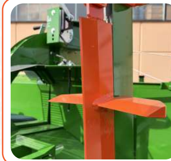
ASCIA IDRAULICA 2/4-2/6 PEZZI