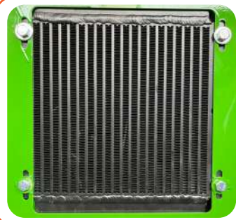
RADIATORE RAFFREDDAMENTO IMPIANTO IDRAULICO